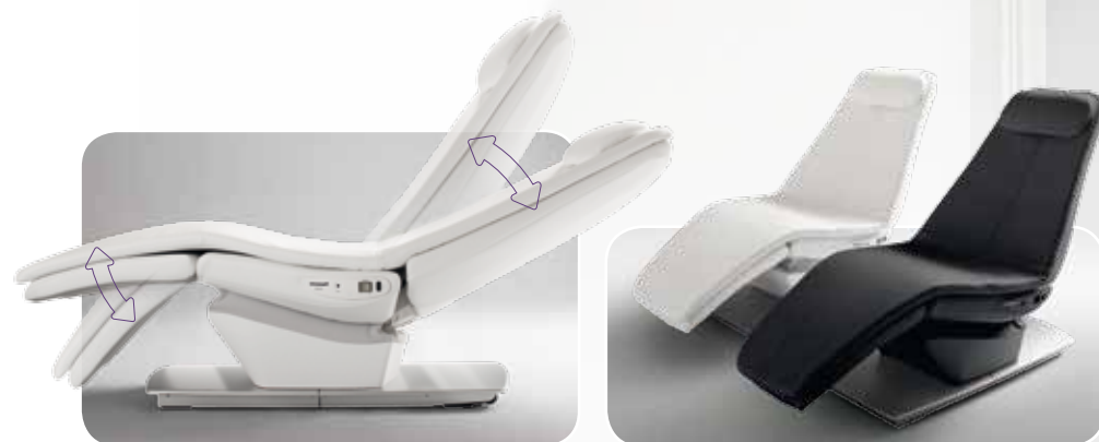
Relaxstolens steglösa inställning av sittpositionen ger dig valmöjligheter och bästa liggkomfort.

Relaxstolens ligg- och sittlägen är steglöst inställbara. Du väljer precis vilket läge du vill ha när du njuter av din bok eller film.